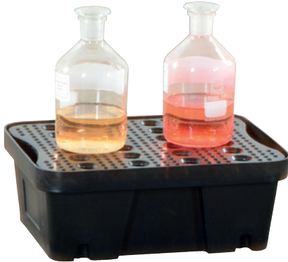
PE-10, mit PE-Lochplatte, Artikel-Nr. P70-2011-A