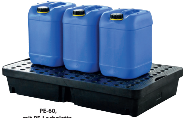
PE-60, mit PE-Lochplatte, Artikel-Nr. P70-2007-A