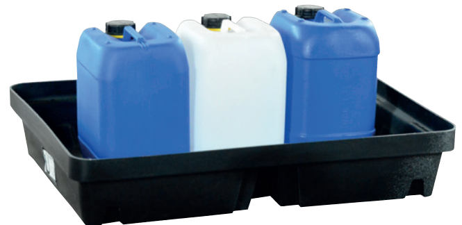
PE-40, ohne Stellebene, Artikel-Nr. P70-2006-A