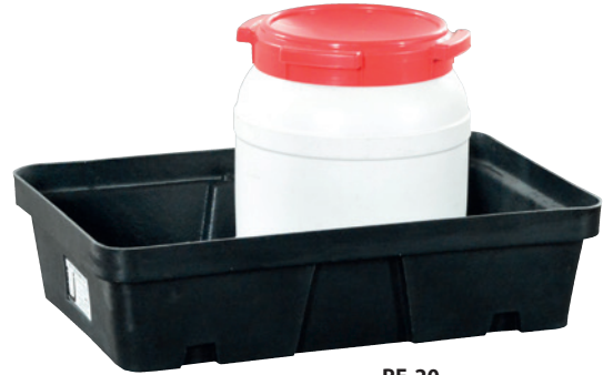
PE-20, ohne Stellebene, Artikel-Nr. P70-2002-A