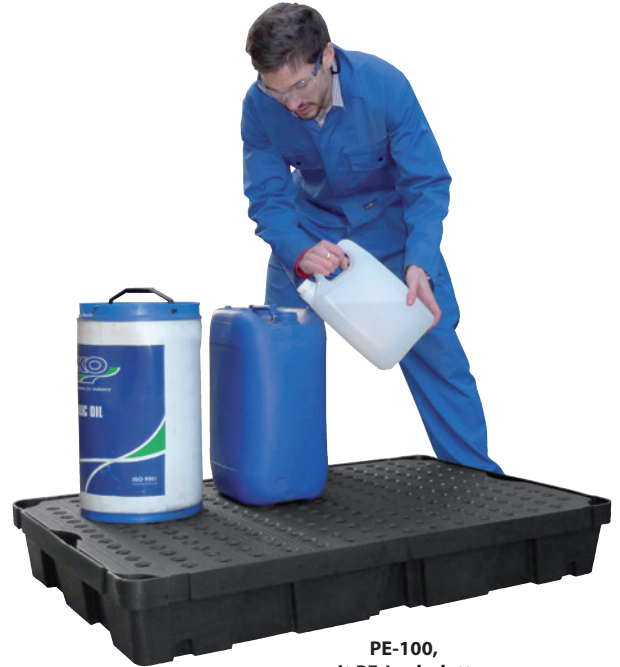
PE-100, mit PE-Lochplatte, Artikel-Nr. P70-2009-A