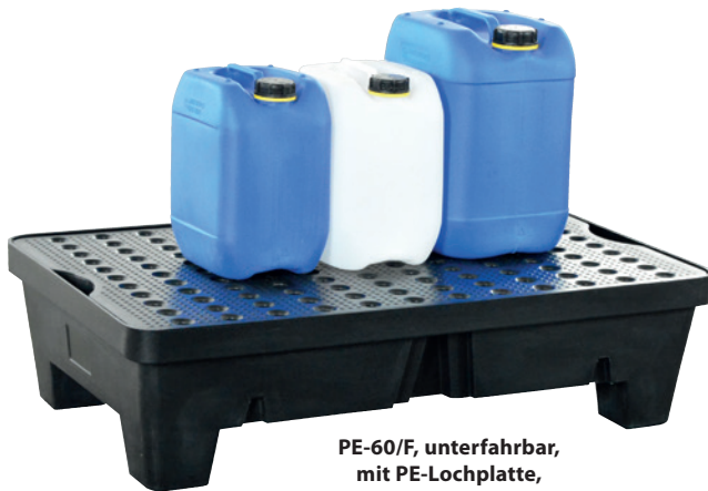
PE-60/F, unterfahrbar, mit PE-Lochplatte, Artikel-Nr. P70-2013-A