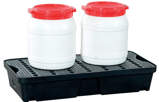
PE-30, mit PE-Lochplatte, Artikel-Nr. P70-2003-A