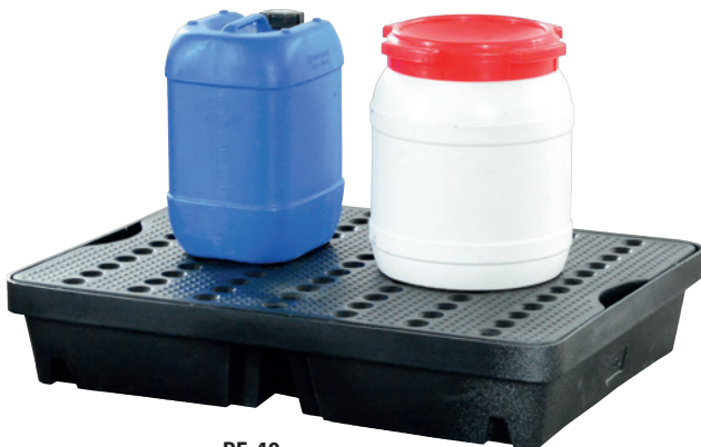
PE-40, mit PE-Lochplatte, Artikel-Nr. P70-2005-A