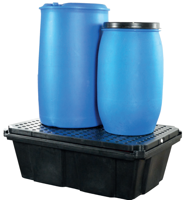
PE-200-6, mit PE-Lochplatte, Artikel-Nr. P70-2029-A