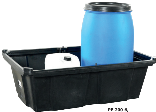
PE-200-6, ohne Stellebene, Artikel-Nr. P70-2028-A