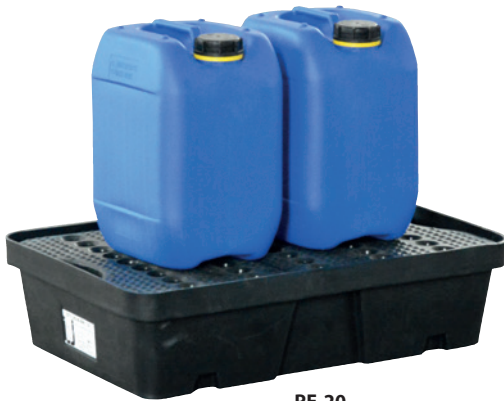
PE-20, mit PE-Lochplatte, Artikel-Nr. P70-2001-A