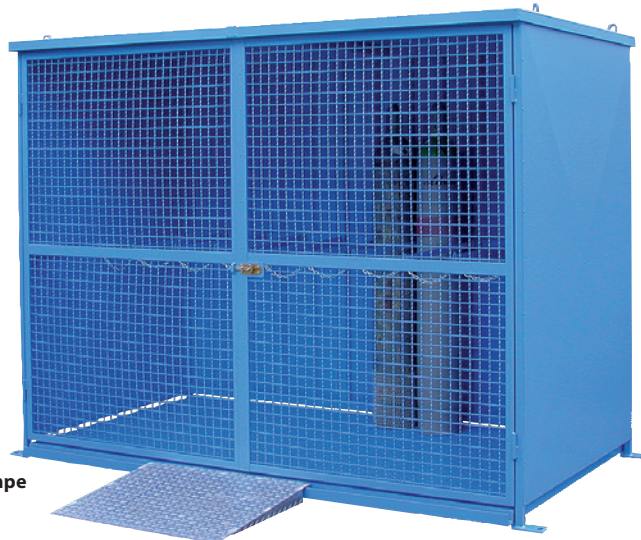
FCG 30.13, mit Bodengruppe, Artikel-Nr. C27-3121-B, mit optionaler Auffahrrampe

Entspricht der TRGS 510 (Technische Regeln für Druckgase)