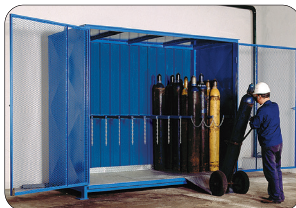
FCG-E.3.48, mit Bodengruppe, Artikel-Nr. C27-3110-B