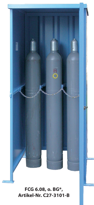
FCG 6.08, o. BG*, Artikel-Nr. C27-3101-B