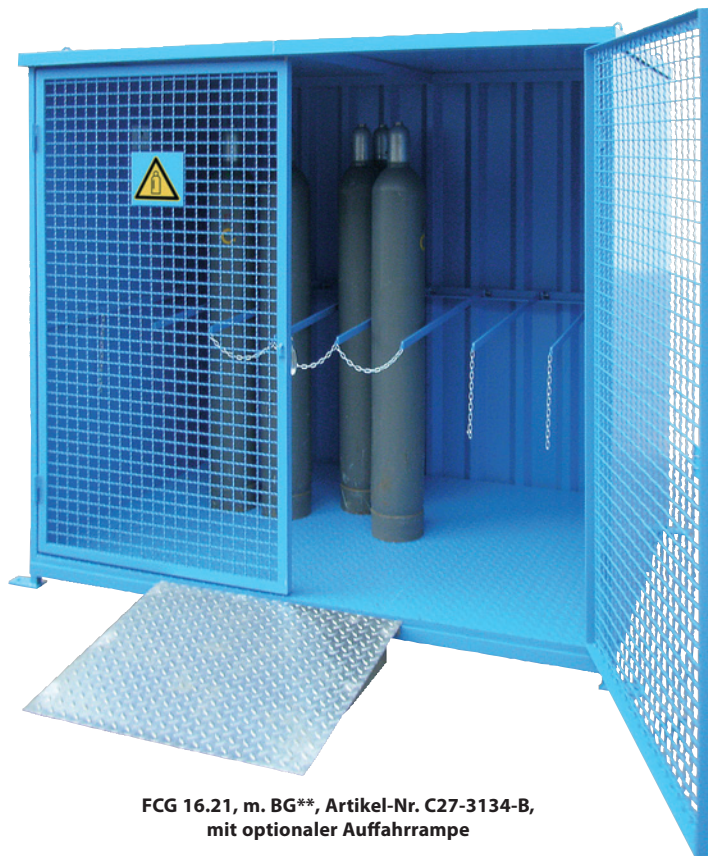
FCG 16.21, m. BG**, Artikel-Nr. C27-3134-B, mit optionaler Auffahrrampe