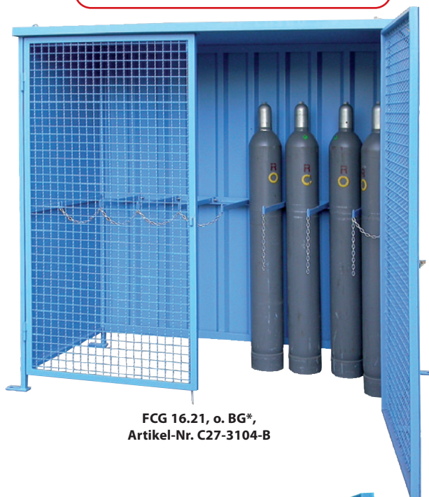
FCG 16.21, o. BG*, Artikel-Nr. C27-3104-B