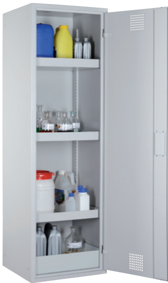
CHS 600, Tür RAL 7035 Artikel-Nr. B80-6134-A