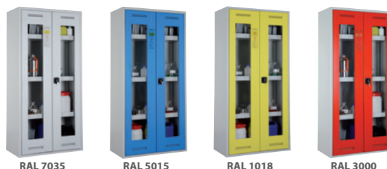
4 Türfarben zur Wahl - ohne Aufpreis!