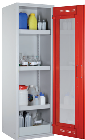
CHS 600 GL, Tür RAL 3000 Artikel-Nr. B80-6180-A