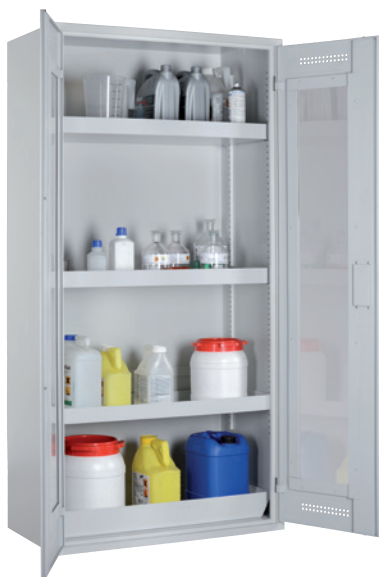
CHS 950 GL, Türen RAL 7035 Artikel-Nr. B80-6216-A