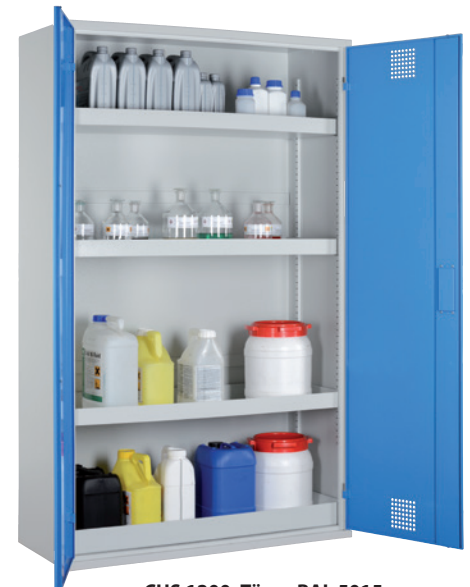
CHS 1200, Türen RAL 5015 Artikel-Nr. B80-6171-A