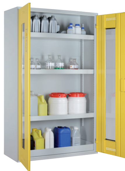
CHS 1200 GL, Türen RAL 1018 Artikel-Nr. B80-6189-A