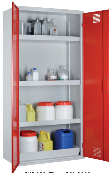
CHS 950, Türen RAL 3000 Artikel-Nr. B80-6169-A