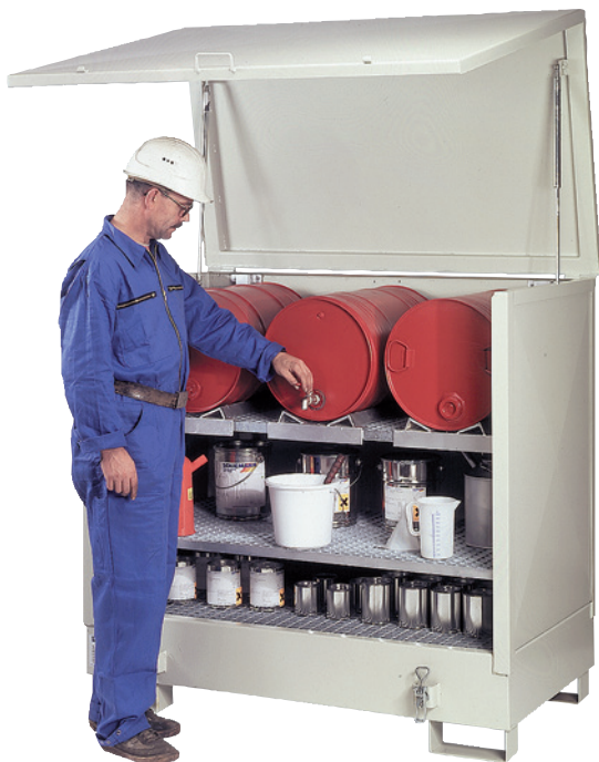
2GSKS, mit Sonderausstattung Regal