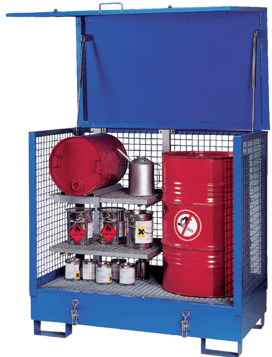
2GSKS / Gitt, mit Sonderausstattung Regal