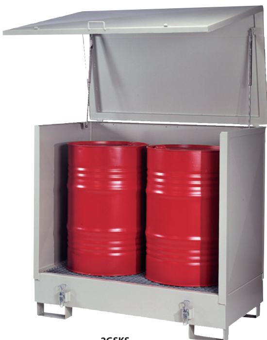
2GSKS, Artikel-Nr. P21-2503-A