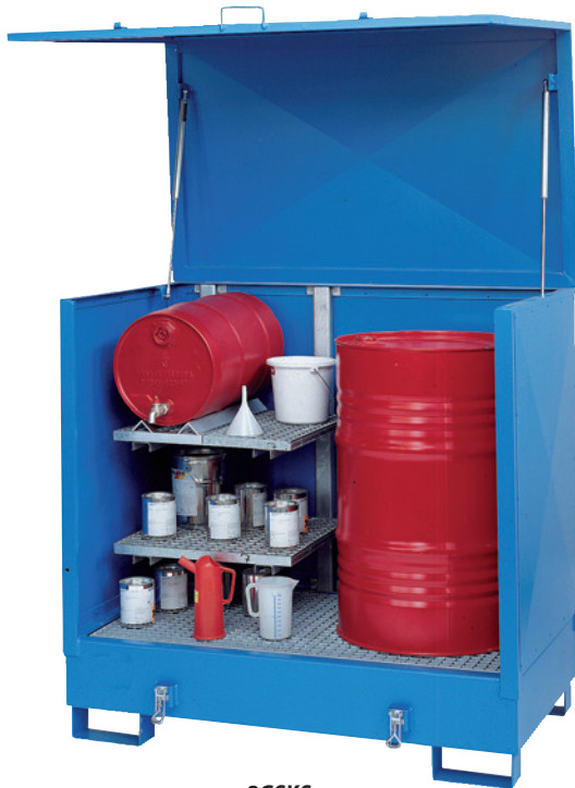
2GSKS, mit Sonderausstattung Regal