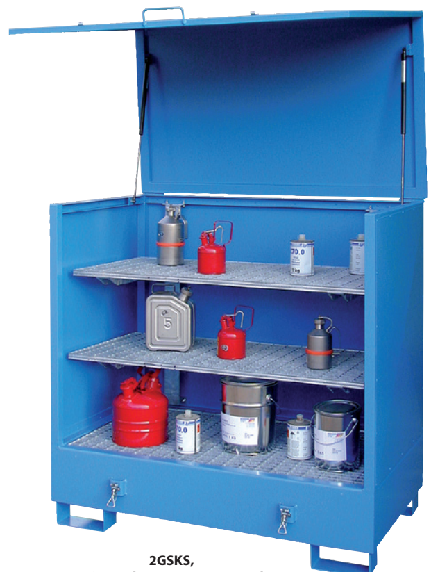
2GSKS, mit Sonderausstattung Regal