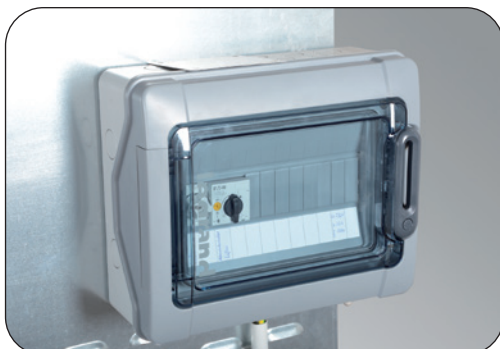
Schaltkasten, inkl. Verdrahtung