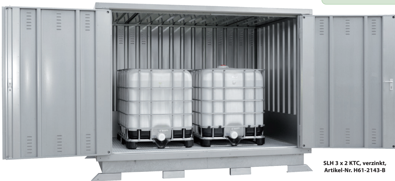
SLH 3 x 2 KTC, verzinkt, Artikel-Nr. H61-2143-B