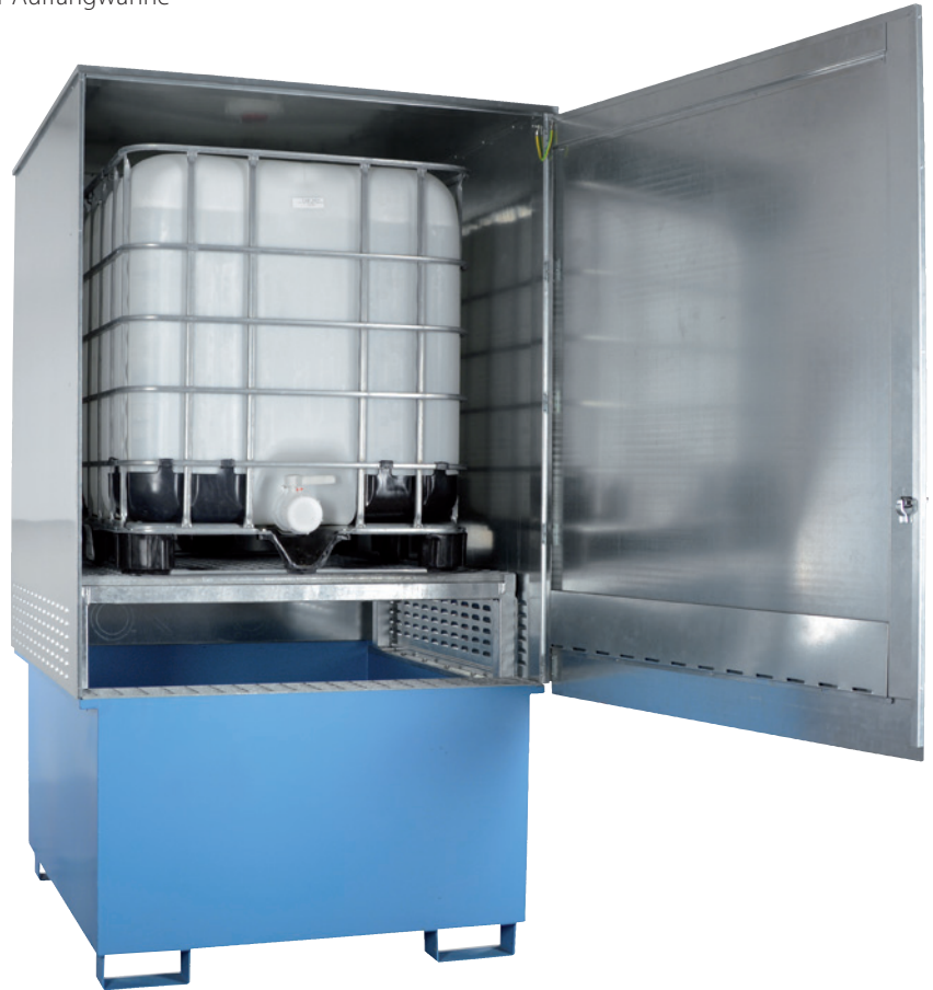
WSP-1SKKS-D/KTC, Artikel-Nr. P21-2485-A