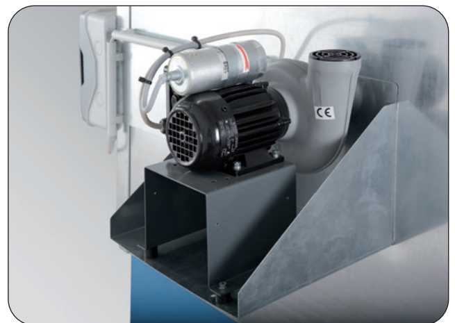
Abluftventilator-Set, Artikel-Nr. P21-2486-A