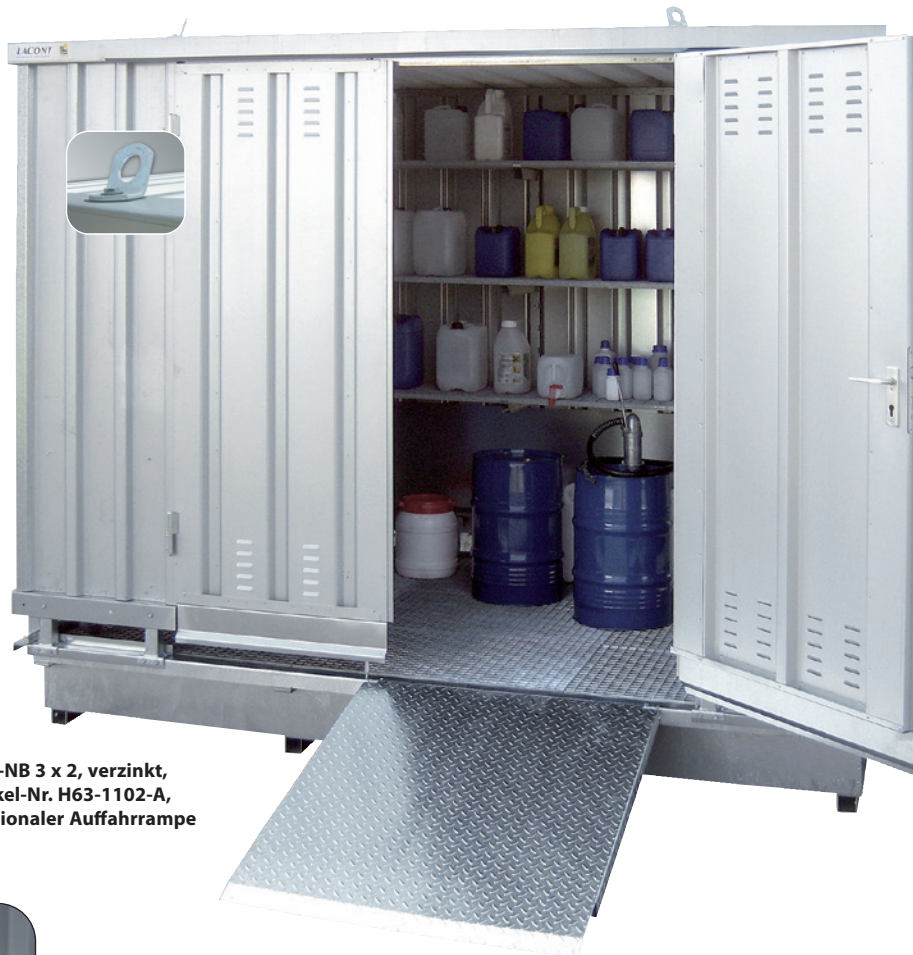
SLH-NB 3 x 2, verzinkt, Artikel-Nr. H63-1102-A, mit optionaler Auffahrrampe

Der Luftwechsel ist geprüft und nachgewiesen gemäß den neuesten Vorgaben des DIBt Berlin!