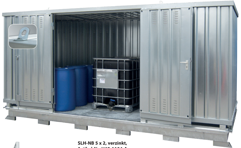
SLH-NB 5 x 2, verzinkt, Artikel-Nr. H63-1104-A

Doppelflügeltür standardmäßig auf der Längsseite, Tür auf der Schmalseite auf Anfrage! Für die Größen 5 x 6, 5 x 8, 4 x 6 und 4 x 8 Doppelflügeltür auf der Schmalseite!