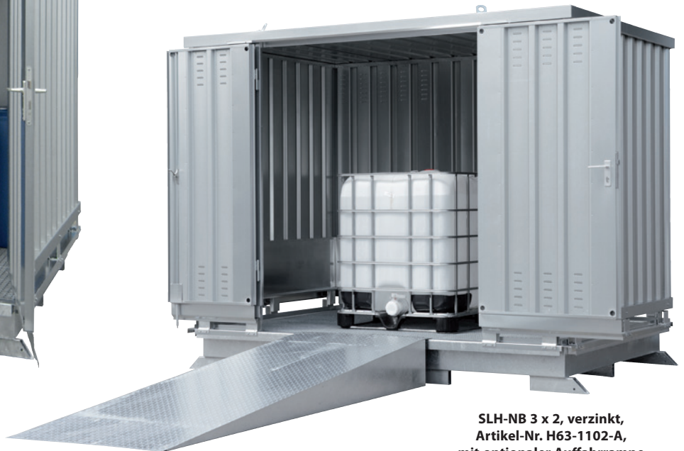
SLH-NB 3 x 2, verzinkt, Artikel-Nr. H63-1102-A, mit optionaler Auffahrrampe