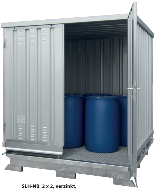
SLH-NB 2 x 2, verzinkt, Artikel-Nr. H63-1101-A