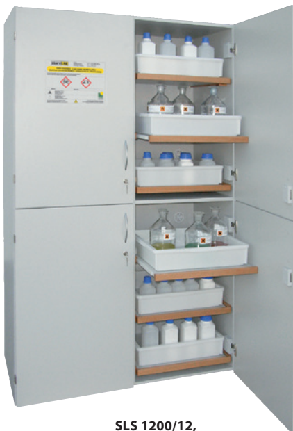
SLS 1200/12, Artikel-Nr. B80-3016-D