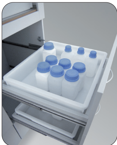
Vollauszugsschubfach mit Endanschlag