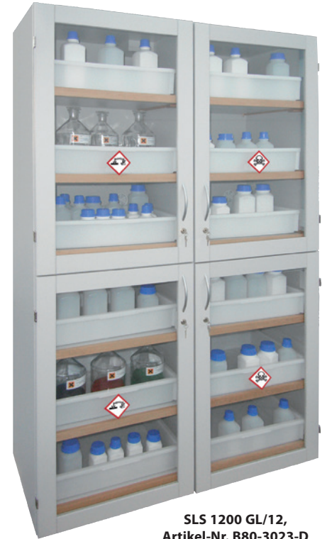
SLS 1200 GL/12, Artikel-Nr. B80-3023-D

Abluft-ventilatoren finden Sie auf Seite 138!