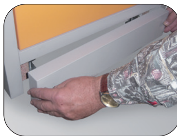
Inkl. Sockel, mit abnehmbarer Blende