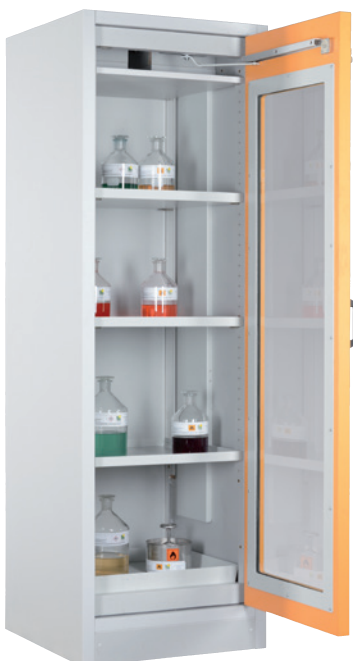
SIS Typ 30 / 600 GL, Artikel-Nr. B80-2655-A, Tür RAL 1007 - narzissengelb, inkl. 3 Einlegeböden, Bodenwanne und Lochblechabdeckung