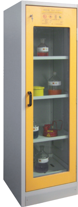
SIS Typ 30 / 600 GL, Artikel-Nr. B80-2655-A, Tür RAL 1007 - narzissengelb, inkl. 3 Einlegeböden, Bodenwanne und Lochblechabdeckung